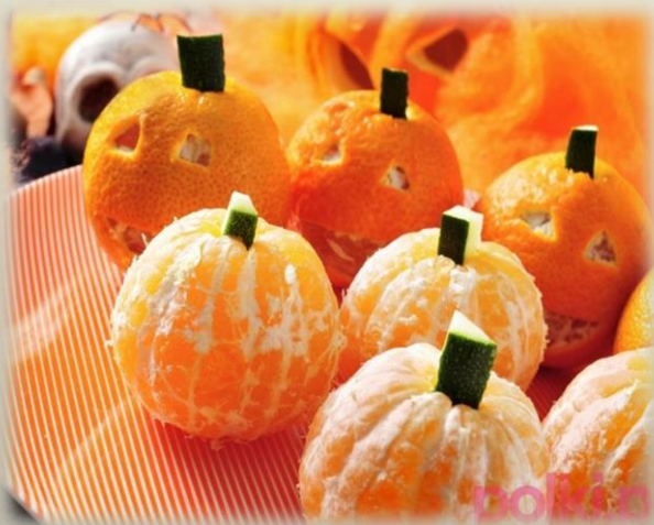
Mandarynki i ogórek