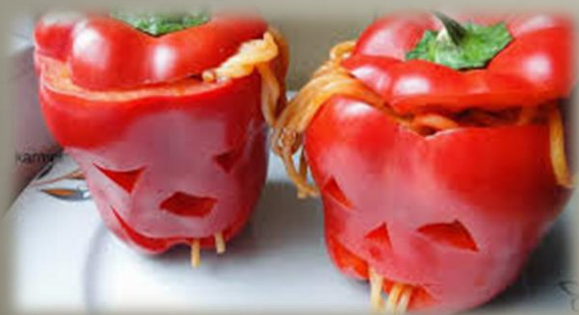
Papryka i makaron z sosem pomidorowym