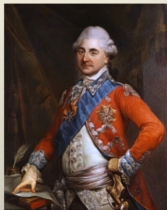
Portret Stanisława Augusta Poniatowskiego – Marcello Bacciarello

traktowane jako uboczne i podrzędne. System ten cechował swoisty konserwatyzm i nietolerancja wobec niekatolików, a jednocześnie oderwanie od realnych potrzeb edukacyjnych. W 1773 zakon jezuitów został rozwiązany przez papieża Klemensa XIV co w Polsce groziło upadkiem edukacji, ale też dało impuls do głębokich reform szkolnictwa. Głównym inicjatorem i architektem powstania Komisji był ksiądz Hugo Kołłątaj.