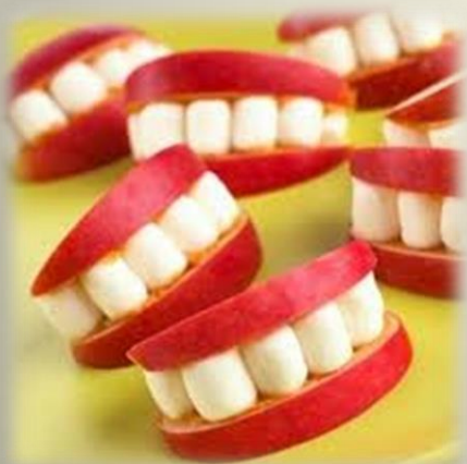
Jabłko i migdały

I jeszcze kilka propozycji, nie mniej efektownych, dla mniej wprawnych kucharzy.