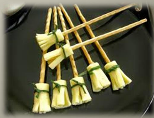
Słone paluszki, plastry żółtego sera i szczypiorek