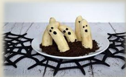
Banan i czekolada, (banana warto skropić sokiem z cytryny)